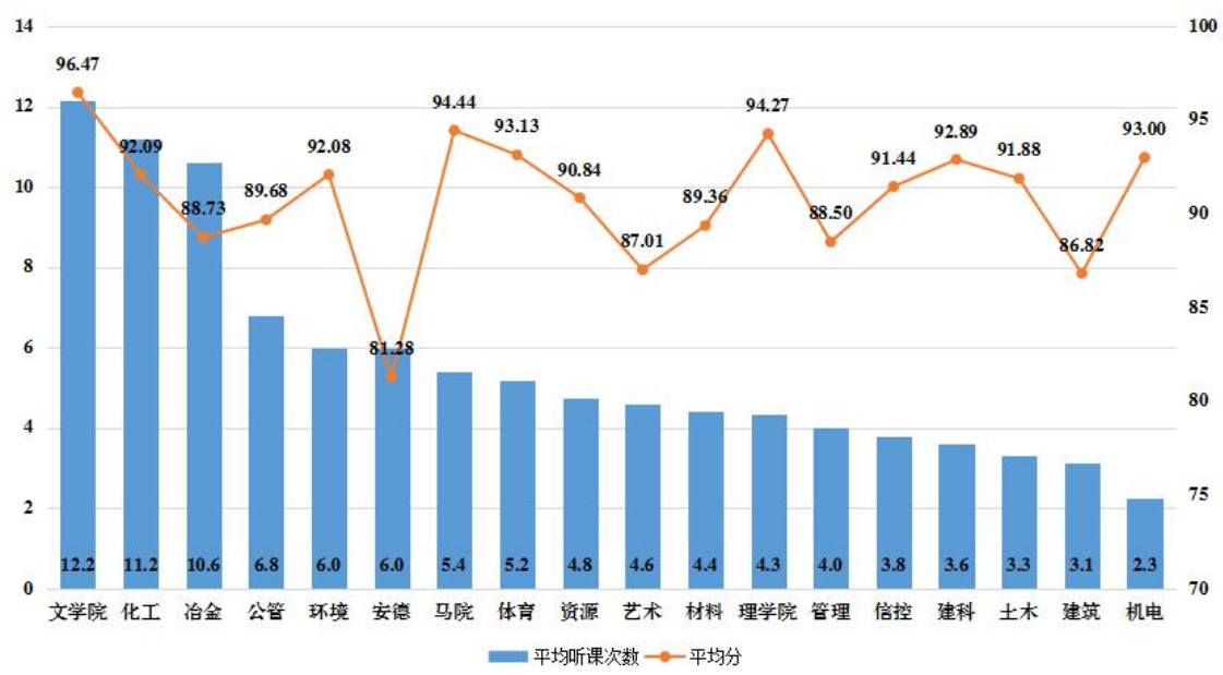
图2 本学期学院领导听课情况分布图