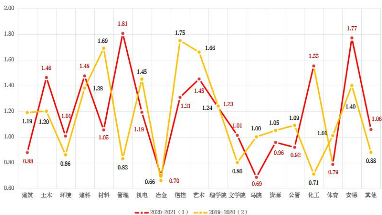
图2 两学期教师评价成绩标准偏差对比

如图2所示，对比2020-2021（1）学期与2019-2020（2）学期评价成绩标准偏差发现，冶金学院、理学院最为稳定，标准偏差变化小于0.05，管理学院、化工学院教师评价成绩标准偏差较大，标准偏差变化接近1。建议学院关注教师教学整体水平，促进本学院教师教学效果的同时，强化教师授课效果的稳定性。