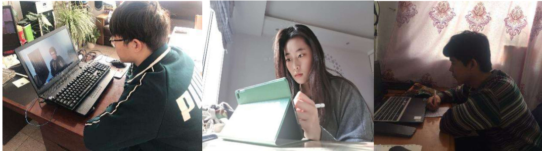
同学们在专心地听讲