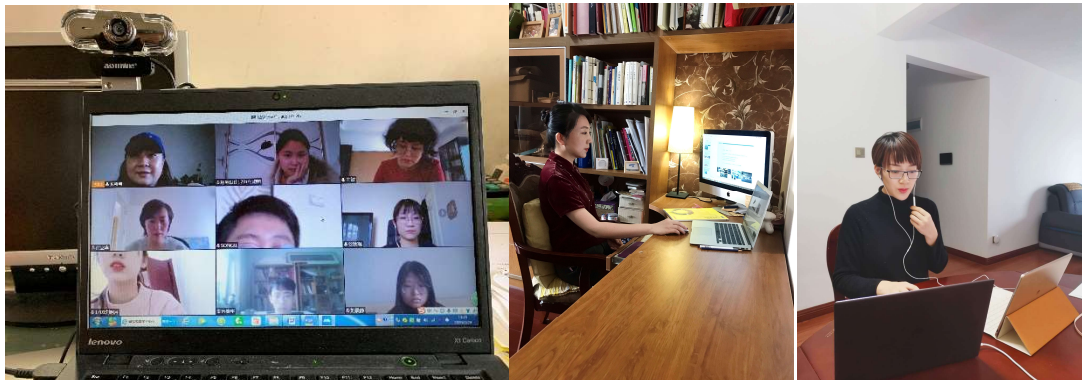
老师们在认真地进行线上教学

前期工作做得扎实，在线教学顺利开展。开课第一天，我院共有21门课程进行线上教学课程，涉及29名任课教师，1137人次学生、累计在线时长65个小时。任课教师们使用腾讯课堂、腾讯会议直播、雨课堂、中国大学慕课、学习通等多种软件进行教学，教学秩序井然，学生学习热情高涨，出勤率基本达到百分之百。