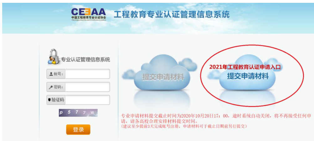
图 1 持续改进情况报告及年度报备材料提交入口

请在“工程教育专业认证管理信息系统” http://login.ceeaa.org.cn/ ，首先选择右侧“2021 年工程教育认证申请入口”（如图 1 所示），然后点击进入持续改进情况报告和年度报备材料提交登录界面（如图 2 所示）