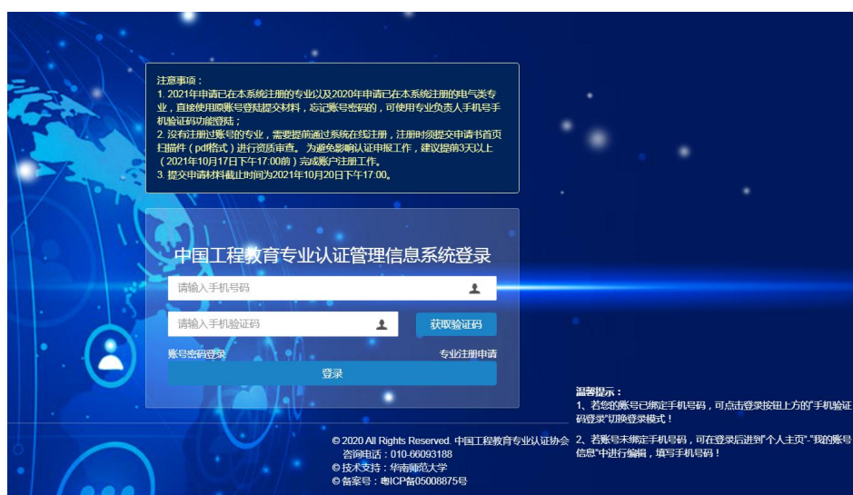
图 3 “手机验证码登录” 登录界面

请专业首次登陆后在“个人主页”及时修改密码并绑定手机号。绑定手机号后，可通过点击“登录”按钮上方左侧的“手机验证码登录”切换登录模式，以手机号获取验证码登录系统（如图 3 所示）。