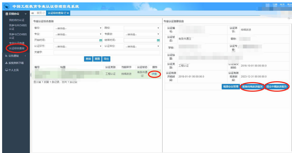
图 4 “填写专业联系人信息”界面

“日常办公” -> “认证综合查询” -> “详情” -> “修改联系人信息”，如图 4 所示：