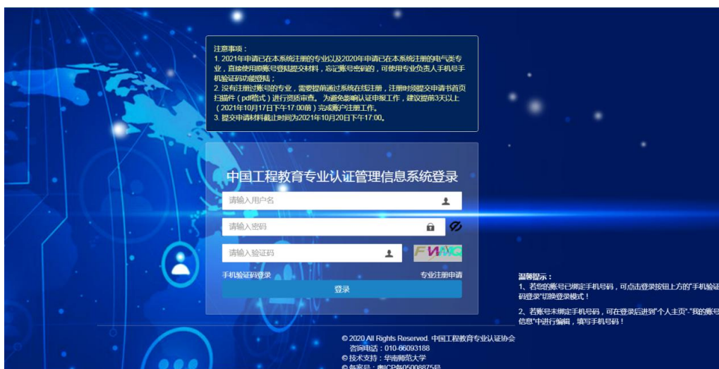
图 2 持续改进情况报告及年度报备材料提交登录界面